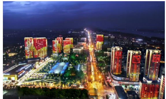
公安县孱陵大道夜景照明