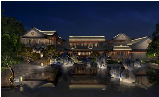
文昌湖区文昌书院配套服务设施建设 EPC 项目 泛光照明工程施工