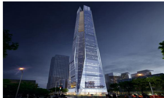
城脉金融中心大厦项目外立面灯光工程