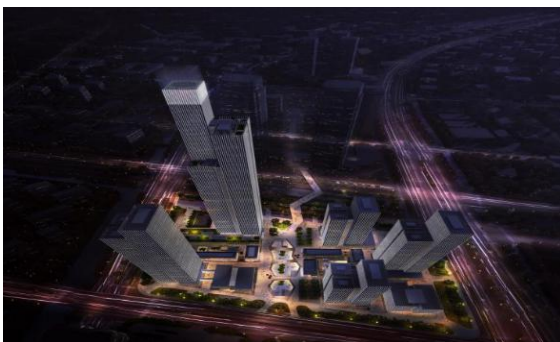
南京金融城二期东区智慧照明