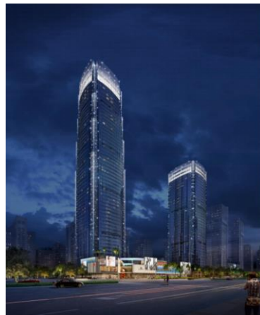
海航中心D10项目泛光照明设计项目