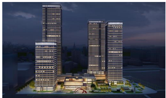
中唯商业中心项目3#楼泛光照明工程