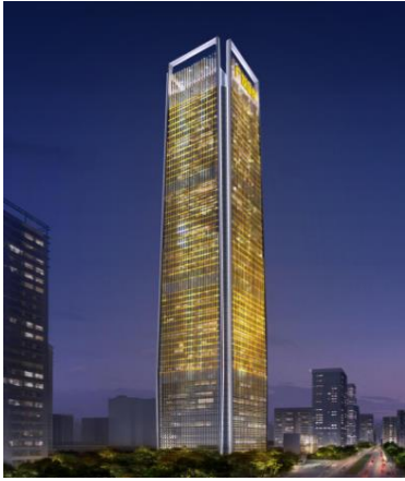
广发证券大厦泛光照明工程设计施工总承包

(1) 报告期内，公司新增200米以上超高层项目有：广发证券大厦泛光照明工程设计施工总承包、顺德农商银行大厦泛光照明工程、上海新江湾城F区F1-D地块商办项目泛光照明专业分包工程、海航中心D10项目泛光照明设计项目、南京金融城二期东区智慧照明、城脉金融中心大厦项目外立面灯光工程、神州数码国际创新中心项目泛光安装工程、华电集团华中总部研发基地项目泛光照明设计（江城之门）、“一江两岸”城市照明提质工程（二期）项目设计采购施工总承包、湖北广电传媒大厦泛光照明工程设计施工一体化、中唯商业中心项目3#楼泛光照明工程。截至报告期末，公司承接高度在200米以上的超高层建筑的楼宇合计65幢。上述新增项目以及其他已承接的主要新增项目（含效果图）如下：