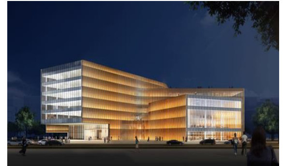
长飞光纤产业大楼项目泛光照明工程