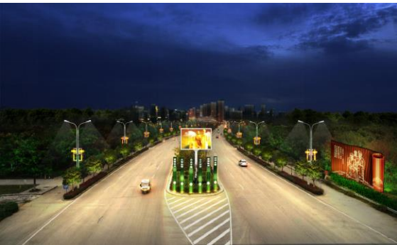
公安县梅园大道夜景照明