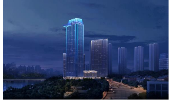
江北嘴B01地块项目泛光照明方案设计