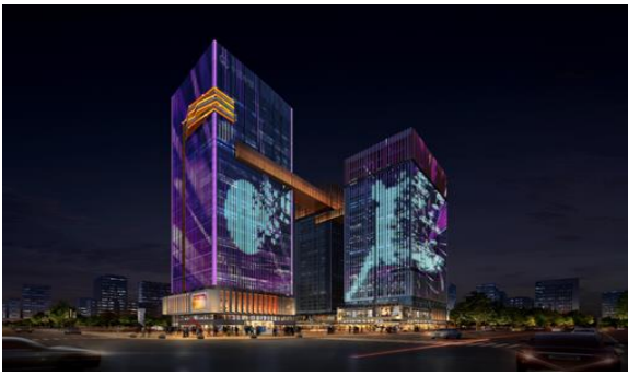
西安中铁丝路总部项目泛光照明工程