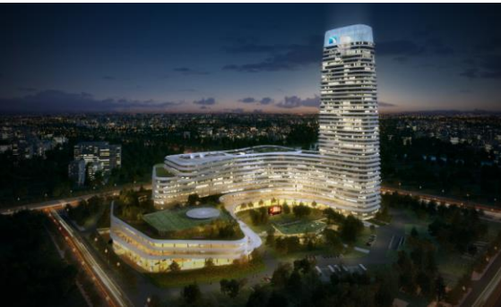
湖北广电大厦泛光照明工程设计施工一体化