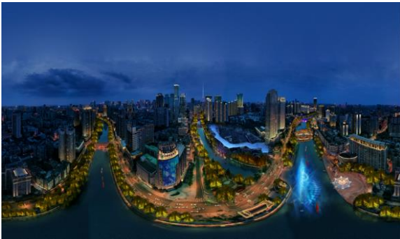
锦江绿道（一期）中心城区段（五丁桥-太升桥）、 （太升桥-合江亭）、（九眼桥-望江楼公园） 锦江航线两岸照明提升项目