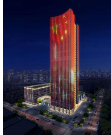
顺德农商银行大厦泛光照明工程