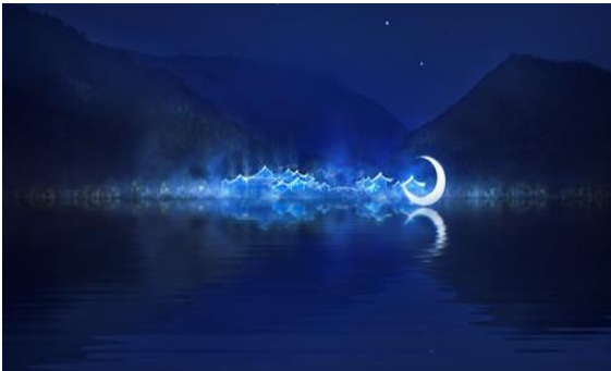
沿江两岸江滨公园整体景观性照明提升工程初步设计