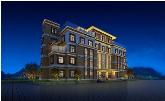
阿坝州财政政务后勤服务中心九寨楼等楼栋光彩亮化工程 (设计提升及实施安装) 采购项目