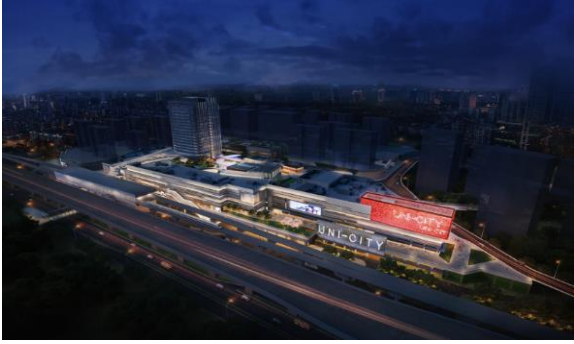
徐泾镇徐盈路西侧地块开发项目 泛光照明专业分包工程