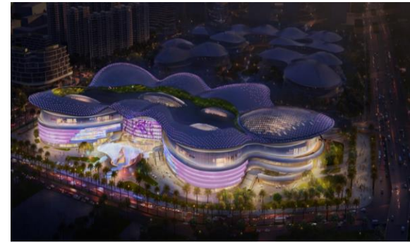
海口市国际免税城项目（地块五）泛光照明专业承包工程