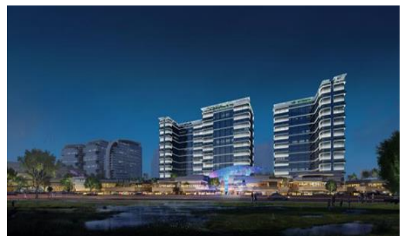
南京 G33 奇雅项目 D 地块 夜景亮化专项设计