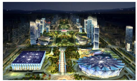
招商局丝路中心项目南、北地块泛光照明工程