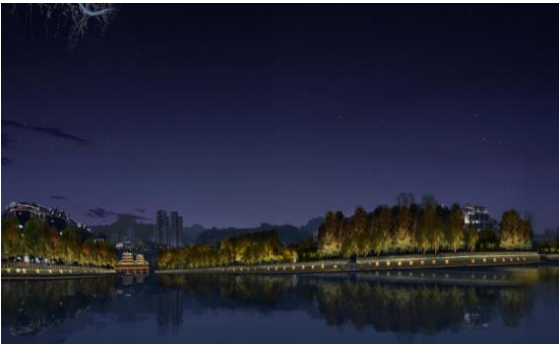
武陵会客厅夜间经济氛围提升项目（一期）