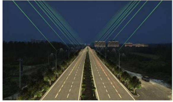
公安县竹溪大道夜景照明