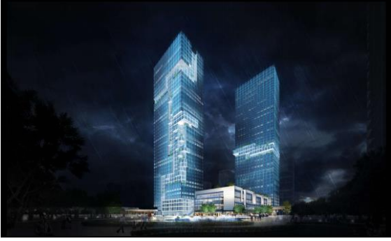
神州数码·国际创新中心泛光安装工程