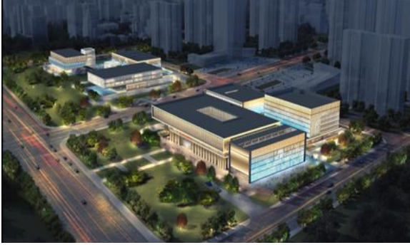
武汉市蔡甸城市综合服务中心工程 泛光照明设计