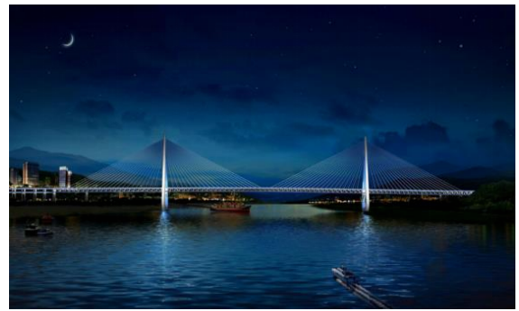
重庆白居寺长江大桥景观灯饰工程