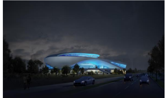
曲江电竞产业园--场馆区项目泛光照明工程