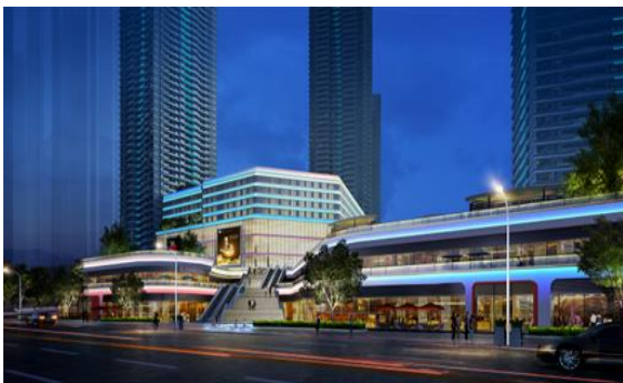
津城壹号项目照明设计