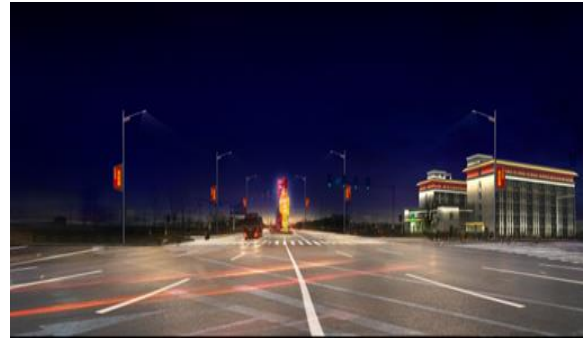
351国道（公安南至兴业路段）、（兴业路至上海大道） 路灯工程EPC总承包