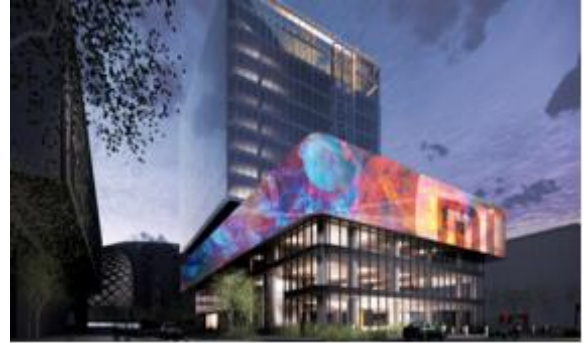
小米集团深圳总部项目 泛光照明设计