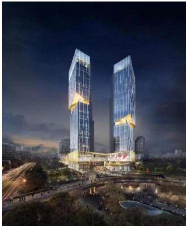
上海新江湾城F区F1-D地块商办项目 泛光照明专业分包工程