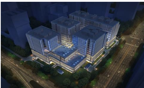
石景山区中关村科技园石景山园北II区西井地块土地 一级开发项目1606-034地块B1商业用地项目