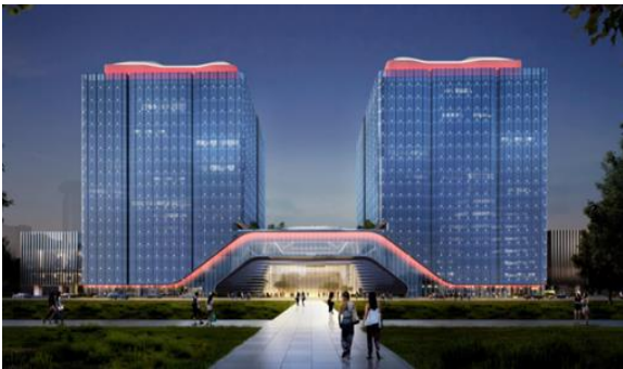
魏公村小区棚户区改造项目（1#办公商业楼等3项） 泛光照明工程