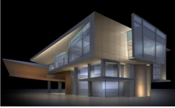
国家会议中心二期（初定）配套部分B24地块 幕墙样板泛光照明工程