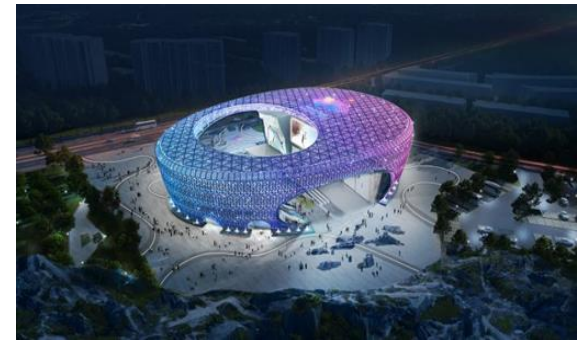
绍兴市柯桥区羊山攀岩中心新建工程 亮化工程采购项目