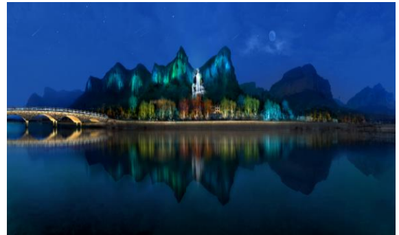
武安市东太行旅游夜经济走廊 建设总承包项目