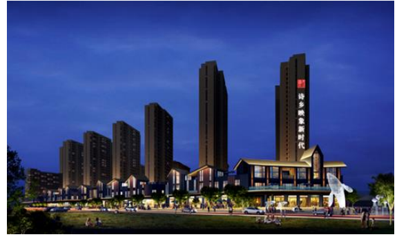
遵义诗乡映像 新时代项目 夜景照明工程设计

(2) 公司成为迪拜世博会中国馆官方合作伙伴&主题灯光展演指定智慧光艺系统服务商。中国馆建筑名为“华夏之光”，寓意希望和光明。中国馆建筑遵循“中西合璧、以中为主、古今交融”的设计原则，将中国元素与现代科技巧妙结合，彰显中华文化自信和大国风范。此次参与世博会项目，是公司国际化战略发展上的又一次重要里程碑，以迪拜市场为核心，立足中东，辐射全球，标志着公司进军新时代国际市场的步伐又迈出了坚实一步。