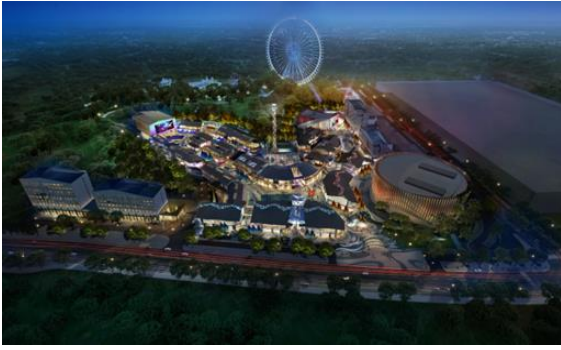
重庆融创·山城印象--文化旅游体验区二期小镇 夜景照明方案至施工图设计