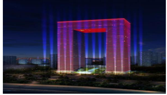
华电集团华中总部研发基地项目泛光照明设计（江城之门）