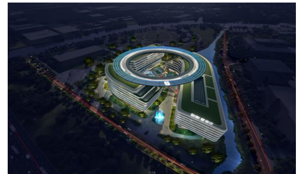
联影智慧医疗园新建项目泛光照明工程设计