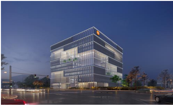
小米集团北京昌平总部二期项目 (智能工厂、未来产业园) 泛光设计