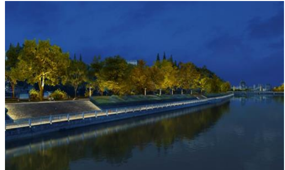
江山市城区亮化一期工程-一江两带 (游览桥-彩虹桥靠西侧) 示范段