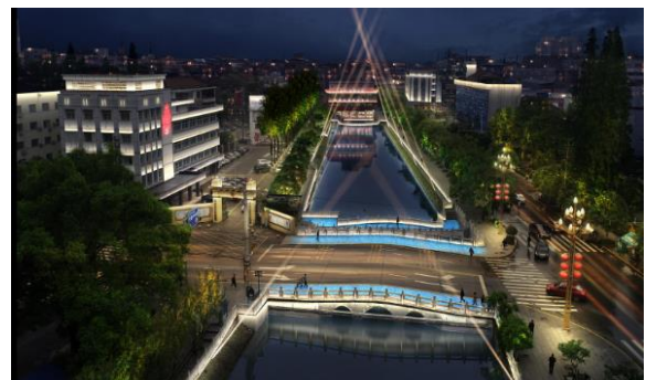
公安县油江河景观照明