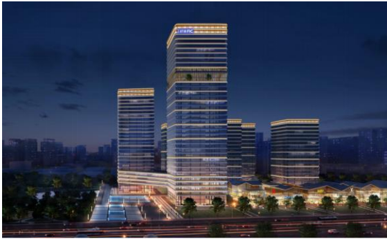
西安金融创新中心一期及二期夜景亮化工程