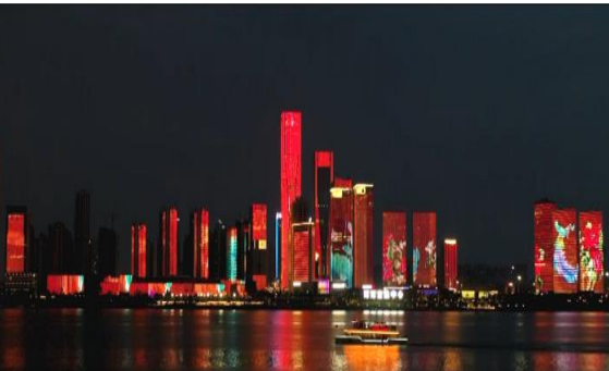
“一江两岸”城市照明提质工程（二期） 项目设计采购施工总承包