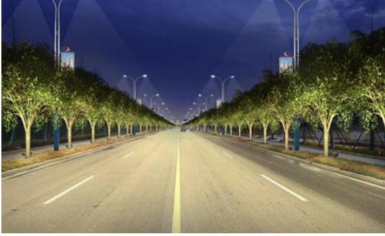
公安县环城路夜景照明