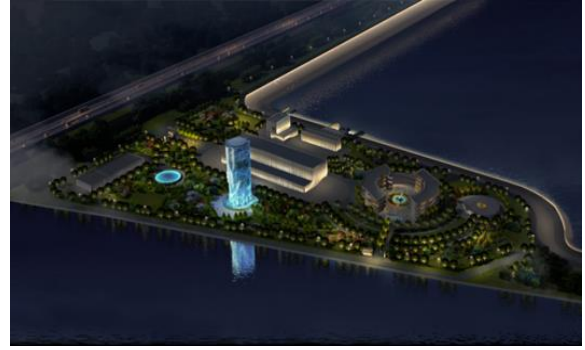
珠江三角洲水资源配置工程 照明设计