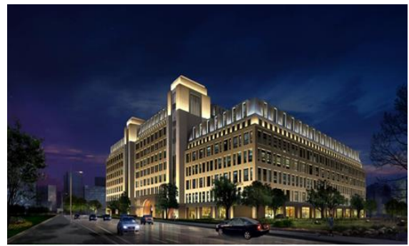
中国平安集团全国后援管理中心3号楼项目 泛光照明专业分包工程